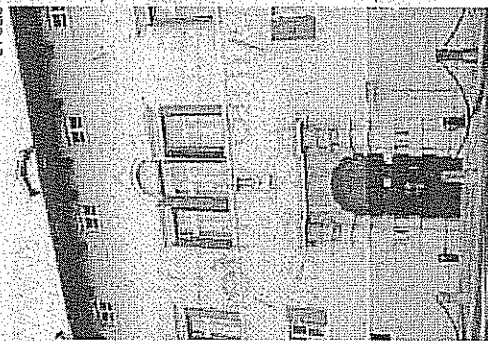
► Palazzo Torriani

esperienze, competenze e tecnologie, al fine di raggiungere gli obiettivi. In particolare le attività condivise riguarderanno lo studio degli attori coinvolti nel settore del turismo, dalle amministrazioni locali ai singoli turisti, dagli operatori commerciali alle pro loco; la definizione di soluzioni personalizzate basate su tecnologie e servizi offerti dai firmatari; lo sviluppo di prodotti integrati e coordinati; infine la creazione di una rete promozionale e commerciale che consenta la valorizzazione e la diffusione della piattaforma realizzata in ambito locale, nazionale e internazionale. ■