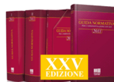
Guida normativa 2011